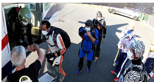
Protections à l'embarquement