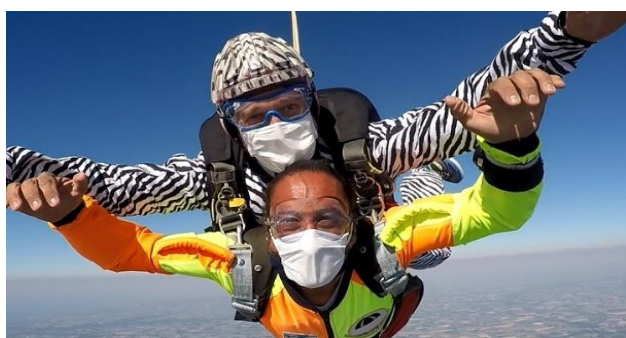
Protections en chute libre