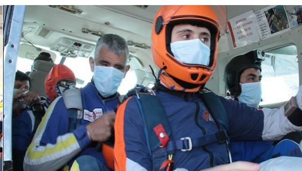
Protections à bord des aéronefs – Equipage exclusivement titulaires du brevet de parachutiste professionnel