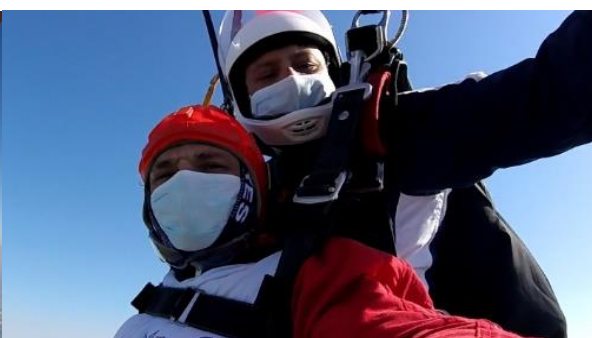
Protections en vol sous le parachute ouvert